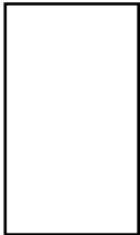
表 9-3 办 费 表

于 办学 ，办学 于 国家 ， 国家 大力 ，但 加大 努力，加 引企入 ， 予 应帮助，助力学 完 学业。